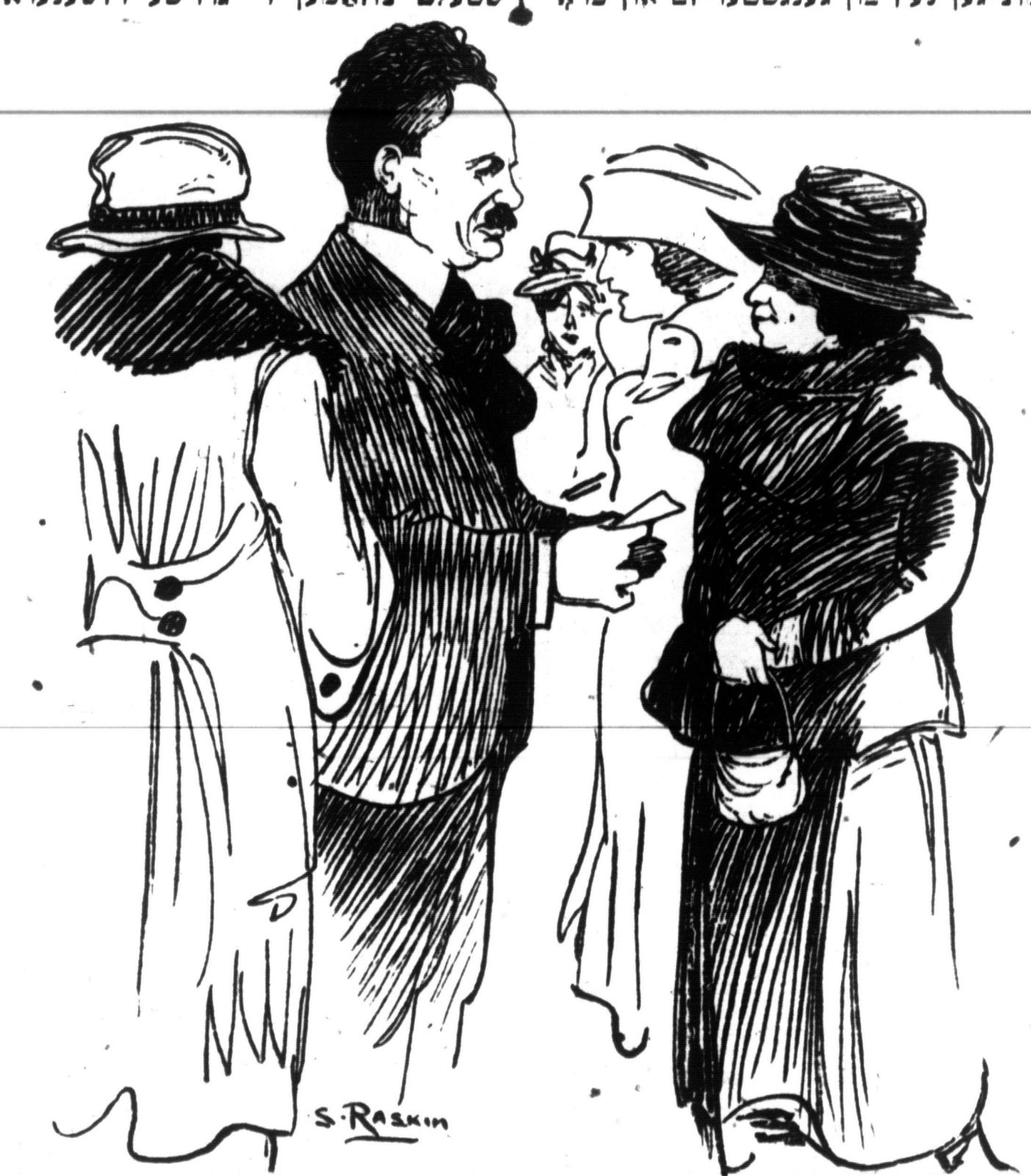
העררי בערלין, פרעזידענט פון קאַטערס יוניאָן לאָקאל 10, מים אַ גרופע סטרייקערינס

אין די פריהערדיגע ארטיקלען איז דער. אַפּטיילונג, רעדענדיג יוענען דעב וואונדערבאַרען מאַכאַניזם פון אונזער דזשענעראל סטרייק קאמיטעס, אַנווייזענ־ דיג ווי וואונדערבאר הארמאניש עס אר־ בייטען די פארשידענע קאמיטעס וואס שטעלט צוזאַמען אָט יענעם גרויסען מאר